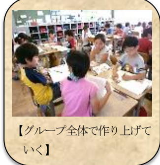
【グループ全体で作りに上げていく】