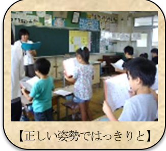
【正しい姿勢ではっきりと】