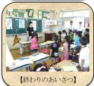
【終わりのあいさつ】