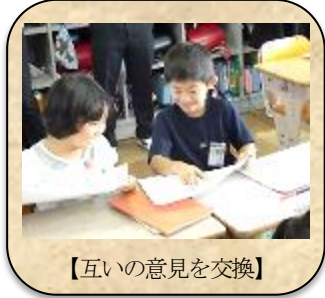
【互いの意見を交換】