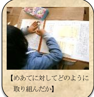
【めあてに対してどのように取り組んだか】