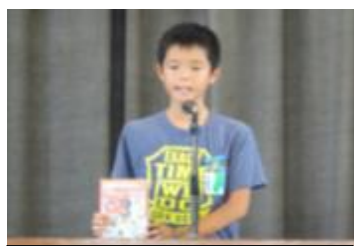
全校ビブリオバトル大会から

子どもたちには、ぜひ、大人になっても思い出せる一冊を持ってほしいと強く願っています。以前、皇后陛下が講演で、子どもたちの読書の意義としてお話しされた「子どもたちが自分の中にしっかりと根を持つために。子どもたちが喜びと創造の強い翼を持つために。子どもたちが痛みを伴う愛を知るために。そして、子どもたちが人生の複雑さに耐え、それぞれに与えられた人生を受け入れて生き、やがて一人一人、私共全てのふるさとであるこの地球上、平和の道具となっていくために。」